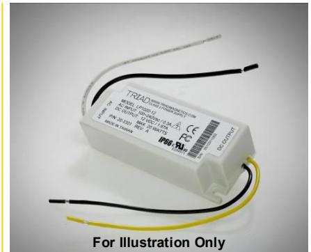
For Illustration Only

Upon printing, this document is considered uncontrolled . Please contact Triad Magnetics website for the most current version.