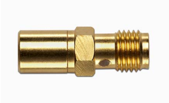
Model 72979 SMA (F) TO SMB (F)