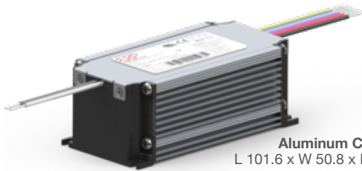
Aluminum Case L 101.6 x W 50.8 x H 38.5 mm (L 4 x W 2 x H 1.52 in)