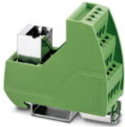
VARIOFACE module with screw connection and RJ45 connector

Please be informed that the data shown in this PDF Document is generated from our Online Catalog. Please find the complete data in the user's documentation. Our General Terms of Use for Downloads are valid ( http://phoenixcontact.com/download )