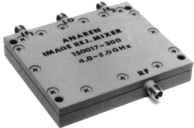
Model 150017-300 shown above

NOTES: Electrical and Mechanical Specifications subject to change without notice