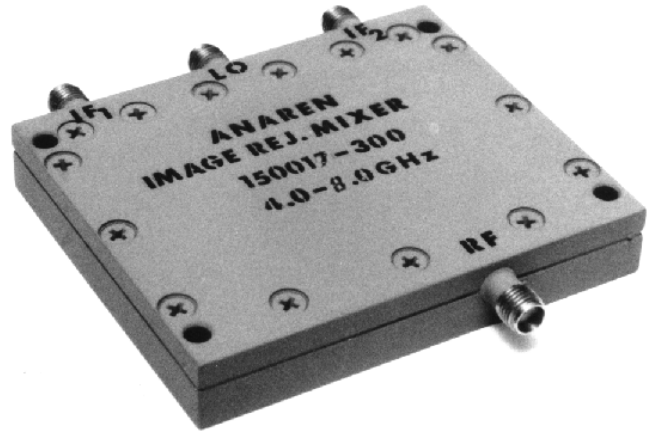
Model 150017-300 shown above

NOTES: Electrical and Mechanical Specifications subject to change without notice