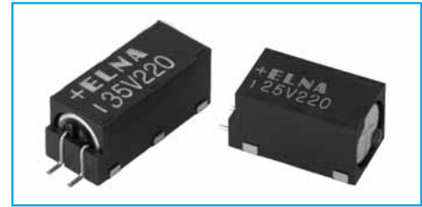
Marking color : White print on a black case