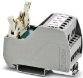
VARIOfACE Professional (VIP) board for the ROC800 controller

Please be informed that the data shown in this PDF Document is generated from our Online Catalog. Please find the complete data in the user's documentation. Our General Terms of Use for Downloads are valid ( http://phoenixcontact.com/download )