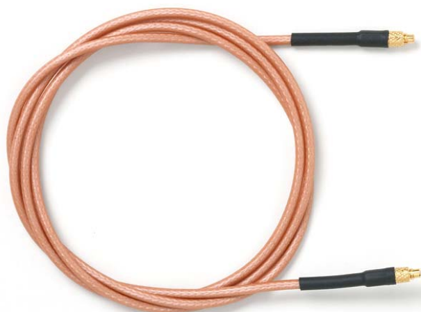
Model 73063 MMCX Plug to MMCX Plug, RG316/U

Snap-on coupling and micro-miniature size for fast connect and disconnect where space is limited