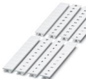
Zack marker strip, 10-section, horizontally labeled with the consecutive numbers: 101 ... 110, white, width: 8 mm

Please be informed that the data shown in this PDF Document is generated from our Online Catalog. Please find the complete data in the user's documentation. Our General Terms of Use for Downloads are valid ( http://phoenixcontact.com/download )