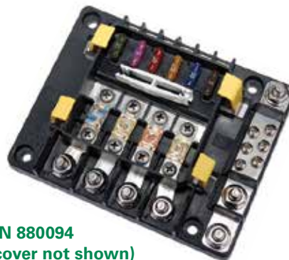
PN 880094 (cover not shown)