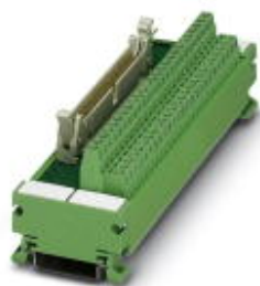
VARIOFACE module, with screw connection and flat-ribbon cable connector, for assembly on NS 35/7.5, 26 positions

Please be informed that the data shown in this PDF Document is generated from our Online Catalog. Please find the complete data in the user's documentation. Our General Terms of Use for Downloads are valid ( http://phoenixcontact.com/download )