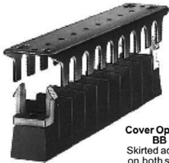
Cover Options BB Skirted access on both sides.