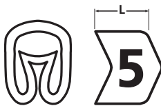
Helagrip chevron cut.