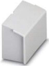
Keying tab 53.6 mm

Please be informed that the data shown in this PDF Document is generated from our Online Catalog. Please find the complete data in the user's documentation. Our General Terms of Use for Downloads are valid ( http://download.phoenixcontact.com )