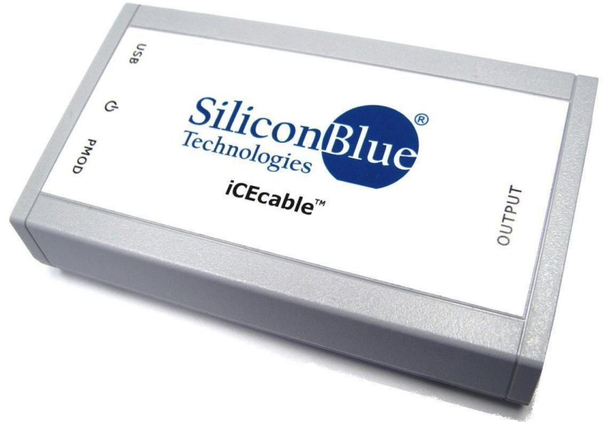
Figure 1: iCEcableM100-01