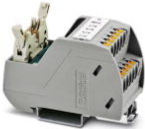
VARIOfACE Professional (VIP) board for the ROC800 controller

Please be informed that the data shown in this PDF Document is generated from our Online Catalog. Please find the complete data in the user's documentation. Our General Terms of Use for Downloads are valid ( http://phoenixcontact.com/download )