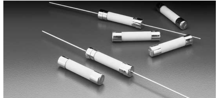
326 000 Series