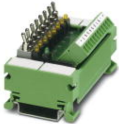
VARIOFACE switch module, with COMBICON connector, for simulation, for 8 signals, for mounting DIN rail NS 35

Please be informed that the data shown in this PDF Document is generated from our Online Catalog. Please find the complete data in the user's documentation. Our General Terms of Use for Downloads are valid ( http://phoenixcontact.com/download )