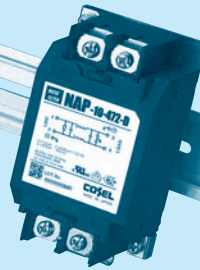
DIN rail installation type is option