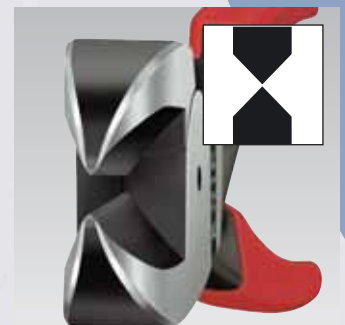
The cutting edges are in the center of the cutter head