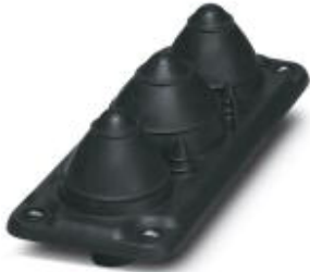
Cable feed-through plates, No. of conductors: 7, Length: 92 mm, Width: 222 mm, Height: 76 mm, Color: black

Please be informed that the data shown in this PDF Document is generated from our Online Catalog. Please find the complete data in the user's documentation. Our General Terms of Use for Downloads are valid ( http://phoenixcontact.com/download )